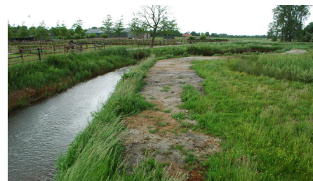
Schade aan de Keersop

De fractie Water Natuurlijk heeft gereageerd op het uitbaggeren van het Natura 2000 gebied de Keersop ten zuiden van Dommelen. Deze maatregel heeft grote schade veroorzaakt aan de abiotische en biotische waarden van de Keersop en heeft het leefgebied van de Beekprik vernietigd. De Keersop is als Natura 2000 gebied aangewezen mede op grond van de aanwezigheid van een belangrijke populatie van de Beekprik. Daarnaast is de actie ook niet te rijmen met het Waterbeheerplan van De Dommel, de gedragscode Flora en Faunawet en de wettelijke eisen van Natura 2000.