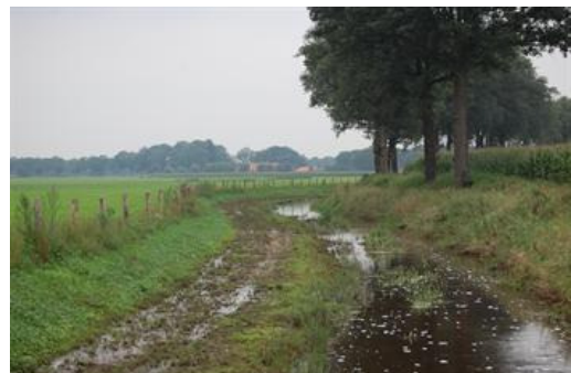
Het 2-fasenprofiel bij hoog en laag water