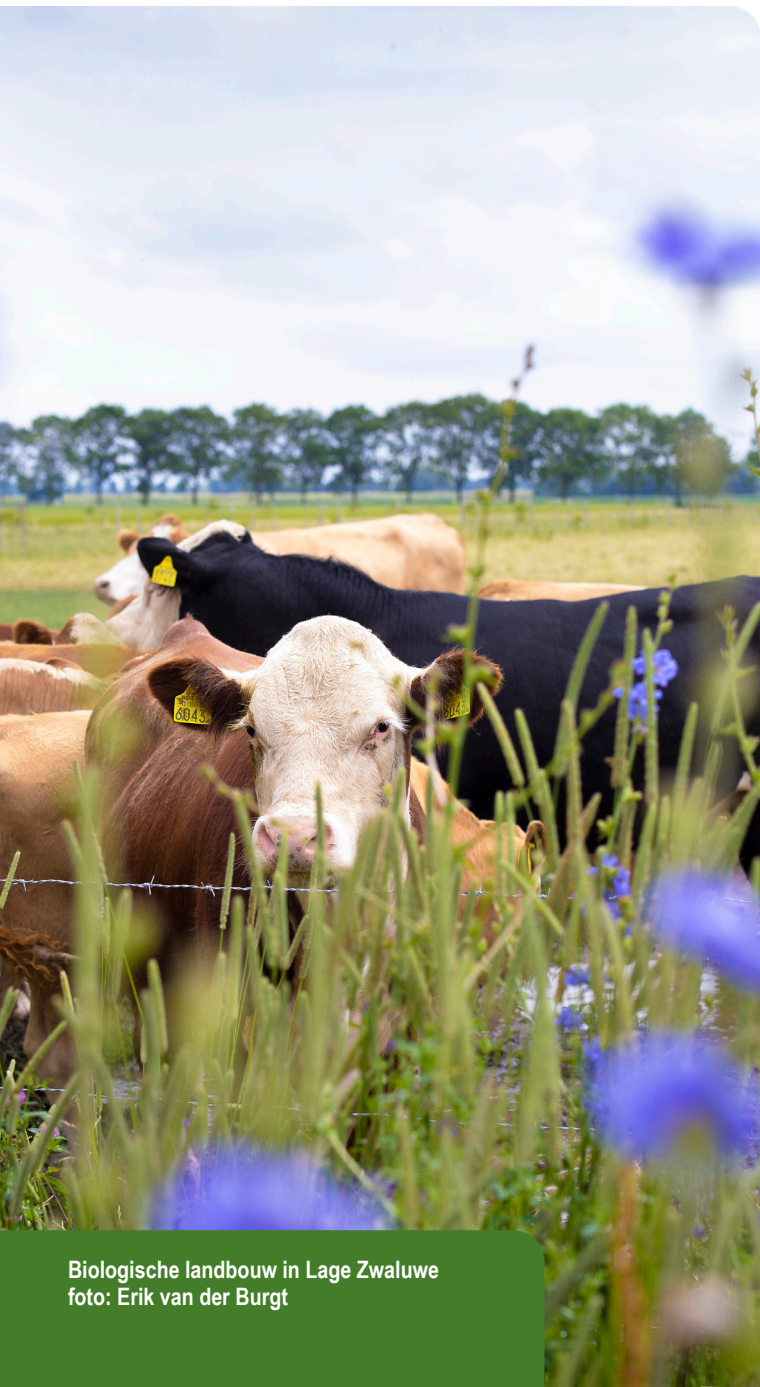
Biologische landbouw in Lage Zwaluwe