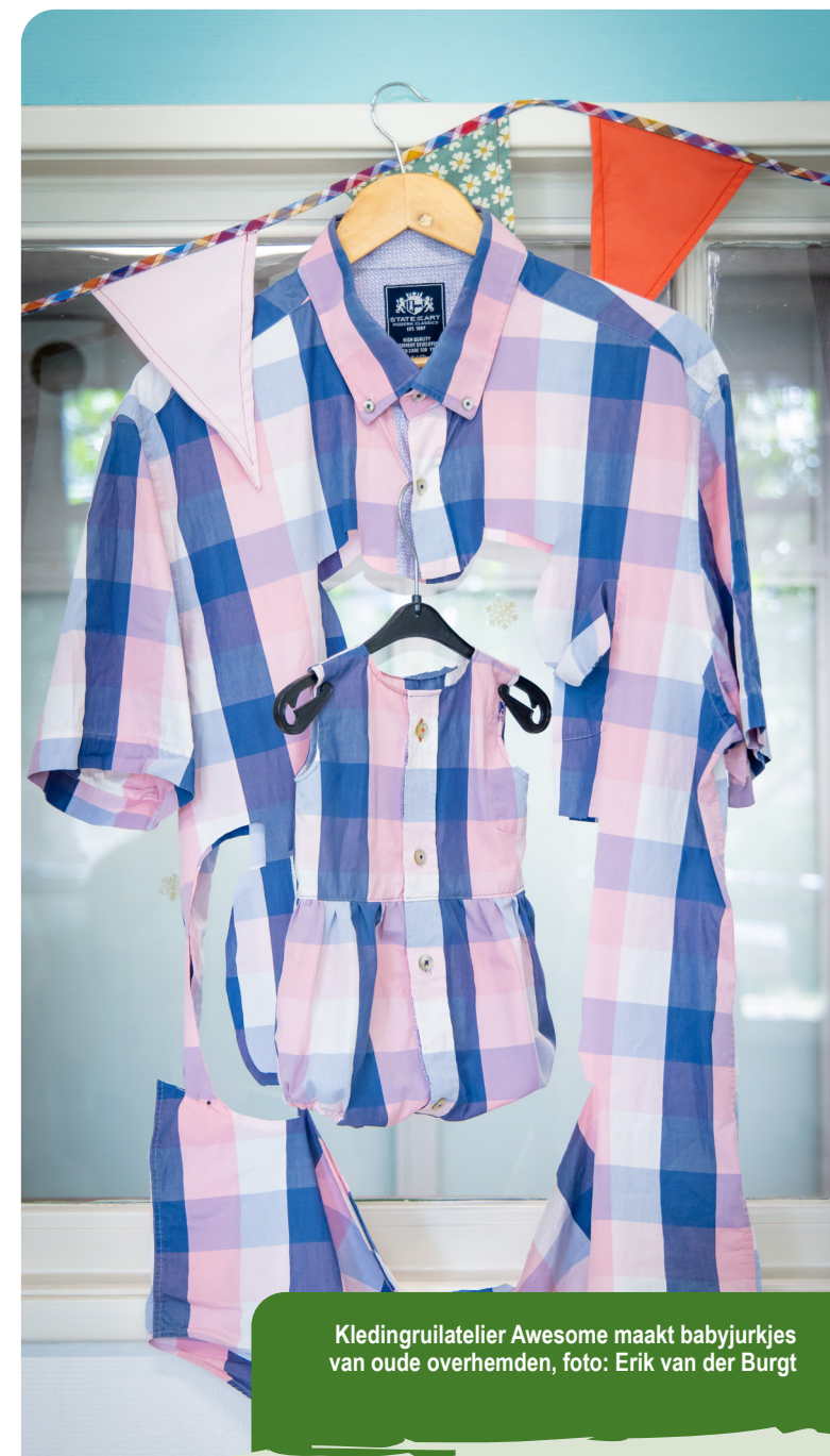
Kledingruilatelier Awesome maakt babyjurkjes van oude overhemden

Financiële middelen voor infrastructuur moeten vooral bijdragen aan projecten die duurzame mobiliteit faciliteren, zoals snelfietspaden, busbanen en OV-hubs. Dan hoeft het wegennet niet verder te worden uitgebreid en kan Eindhoven Airport op termijn krimpen. Brabant beschikt al over een uitgebreid wegennet; meer asfalt trekt nog meer verkeer aan. Met alle gevolgen voor de leefbaarheid en luchtkwaliteit. Voorkom dus onnodige wegprojecten in de toekomst.